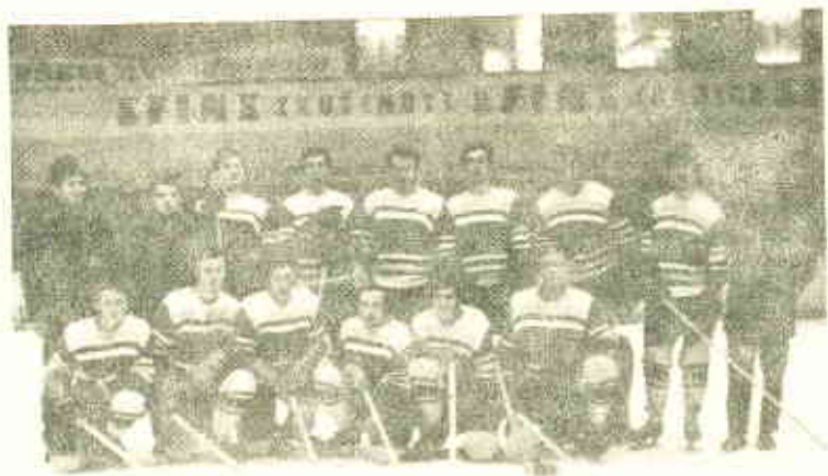
PO VÍTĚZNÉM ZÁPASE SE ŠUMAVANEN VIMPERK do krajského přeboru II. (Výsledek 7:6, sezóna 1969-70)