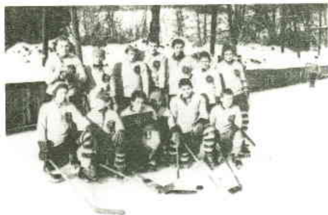
DOROSTENECKÉ DRUŽSTVO z let 1962-1963 (ještě ve fotbalových dresech)