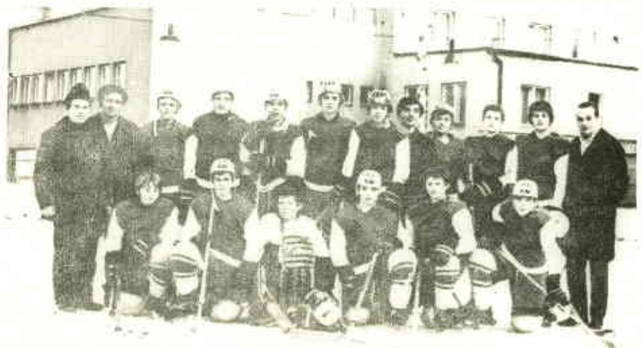
PRVNÍ DRUŽSTVO ŽÁKŮ rok 1973-74