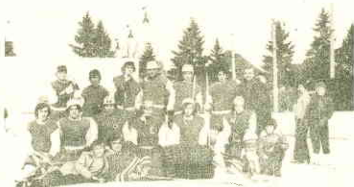
DRUŽSTVO ŽÁKŮ z roku 1974-75