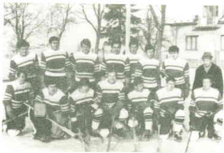
PRVNÍ DRUŽSTVO 2 LET 1968-69