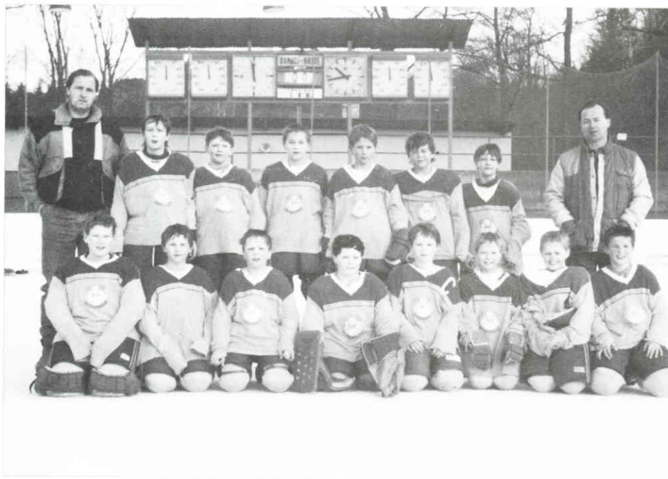
Družstvo mladších žáků z let 1989/90