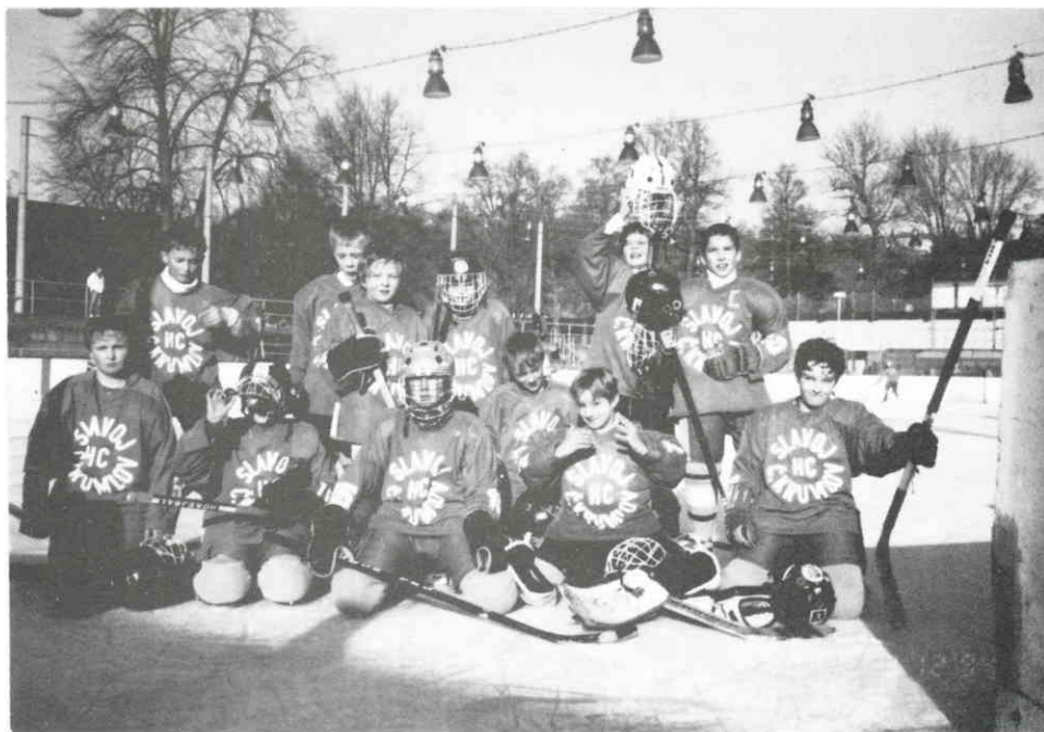
Družstvo základen z let 92/93